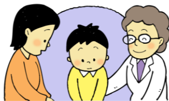
こまったことがあるとき 話を聞いてほしいとき