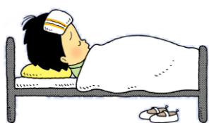
具合がわるいとき